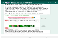
WhatsApp Image 2019-10-31 at 18.36.27.jpeg 78 KB