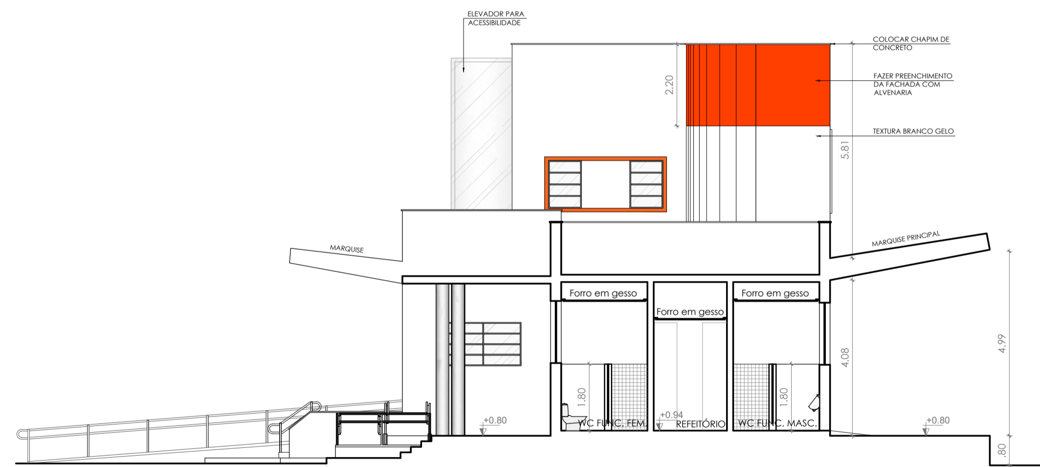
CORTE CC' escala 1/100