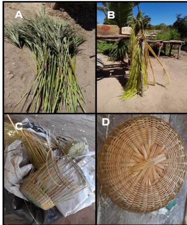
Figura 5 - Beneficiamento das folhas de Buriti para confecção de cestos pela comunidade de Brejo da Conceição no município de Currais, Piauí, para (a) folhas de buriti, (b) secagem das fibras, (c) trançado do cesto, (d) produção do cesto.