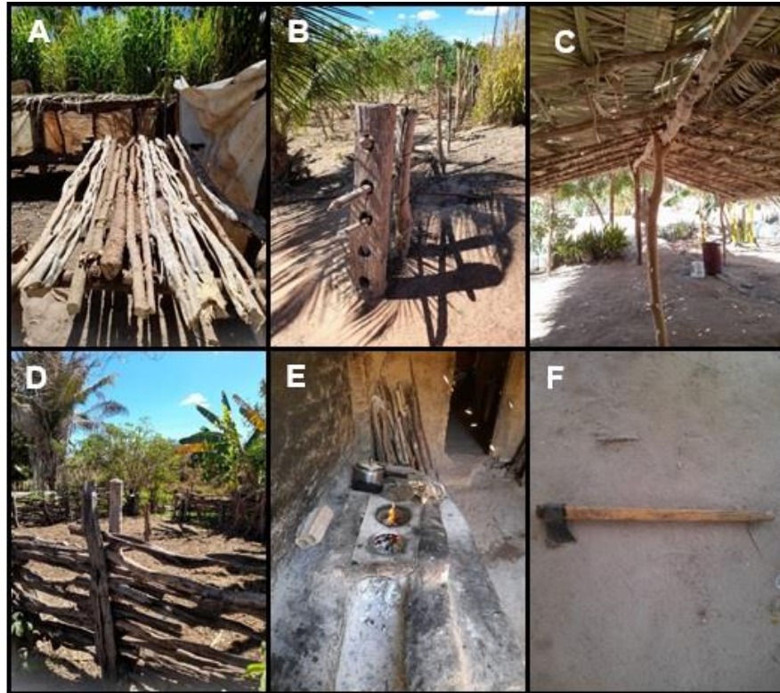
Figura 6 - Utilização de recurso madeireiro pela comunidade de Brejo da Conceição no município de Currais, Piauí, para (a) madeira para construção domiciliar, (b) cerca, (c) cobertura, (d) curral, (e) lenha e (f) cabo de machado.