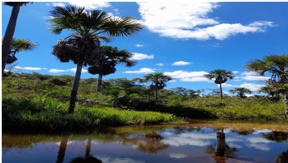
Figura 3 - Palmeira buriti ( Mauritia flexuosa ) na vegetação local.

É banhada por um riacho (Brejo), apresentando trechos de mata ciliar, incluindo-se na composição florística, árvores de grande porte e numerosos indivíduos da palmeira buriti ( Mauritia flexuosa L.) (Figura 3). Os solos da região são em geral arenosos.