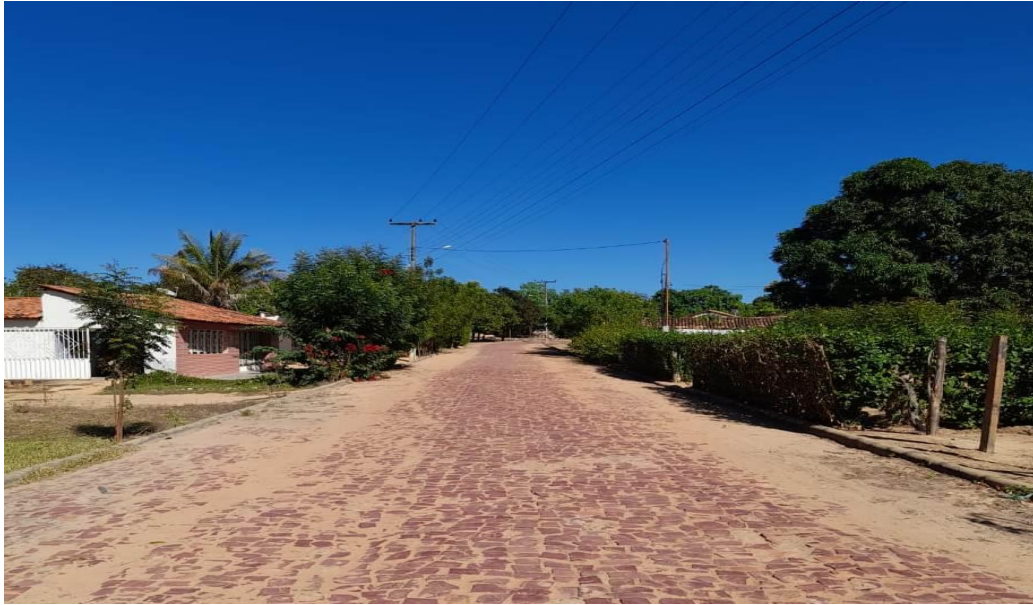
Figura 2 - Visão geral da Comunidade Brejo da Conceição, município de Currais, PI.