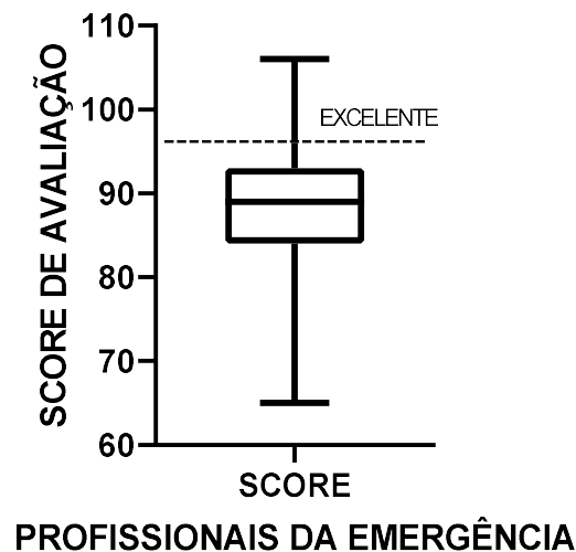
Figura 1 - Representação do escore de acolhimento e classificação de risco por população total de profissionais das emergências de Petrolina (PE) e Juazeiro (BA), 2021, (n=111).

trabalham, conseguindo verificar características em comum e permitindo inferência sobre a percepção profissional. O coeficiente de variação em 8,85% caracteriza as respostas com grau de homogeneidade considerado ótimo, inferindo assim uma opinião geral sobre como acontecia o acolhimento e classificação de risco pela visão dos profissionais de saúde das emergências hospitalares. A ferramenta de classificação de risco é um aliado para organização e gestão de fluxo nos serviços de saúde (OLIVEIRA et al., 2017).