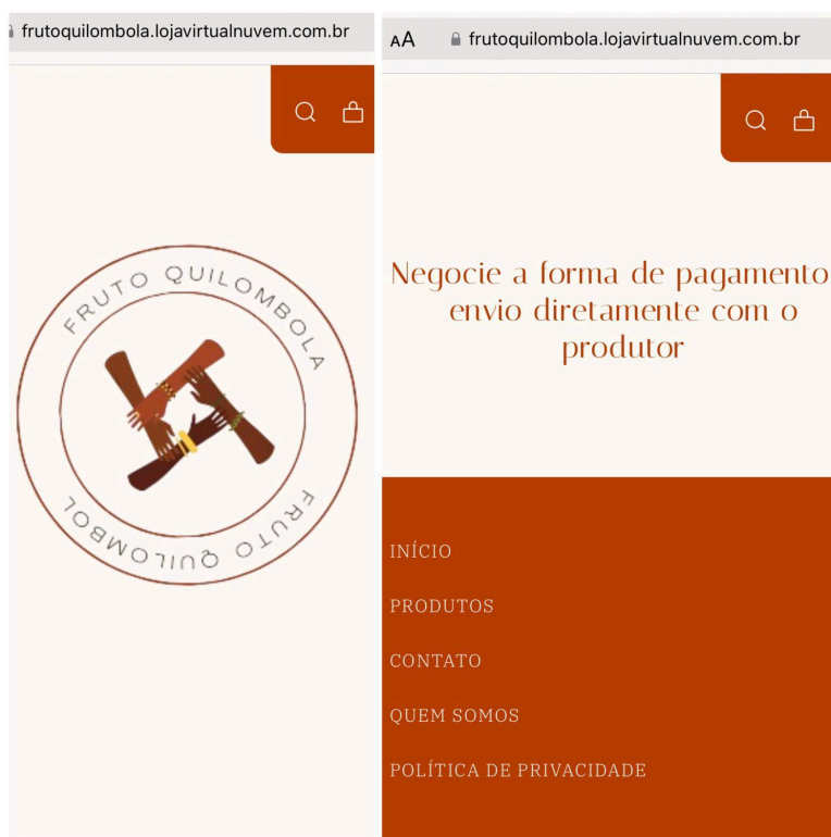
Figura 1 — Página Inicial do site Fruto Quilombola, vitrine dos produtores de Tijuáçu

Este mercado virtual visa ampliar a rede de comercialização dos produtores quilombolas de Tijuáçu, tirando o melhor proveito das tecnologias de comércio eletrônico.