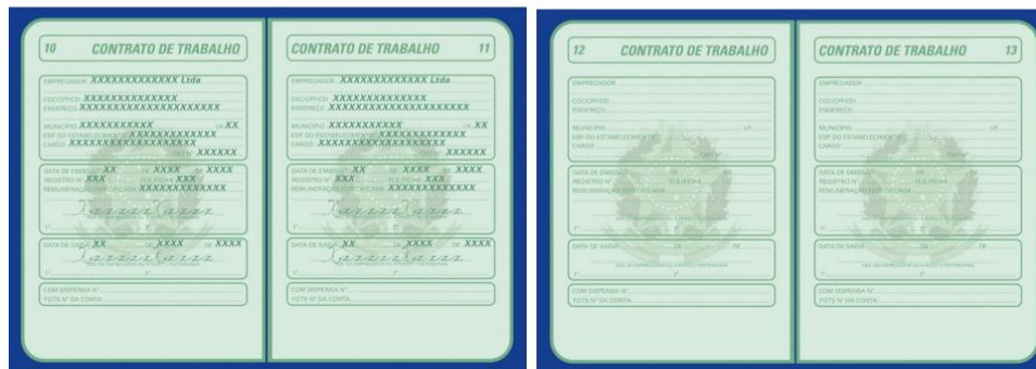
Registro Trabalhista Atual