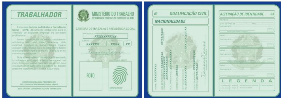
Páginas de Identificação