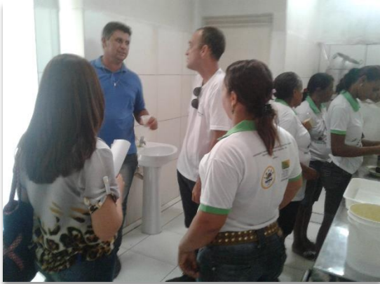
Parte da estrutura interna da Agroindústria