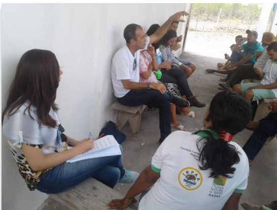
Time Enactus UNIVASF coletando informações