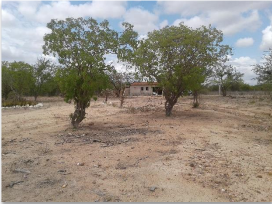
Comunidade de Curral Novo e Jacaré