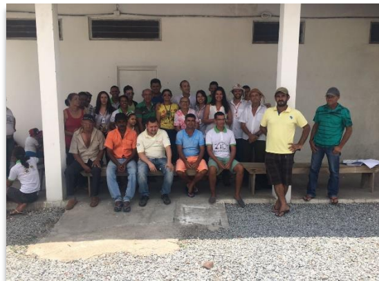
Agroindústria da Associação Comunitária e Agropastoril de Curral Novo e Jacaré e parte dos seus Associados