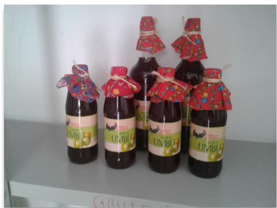
Produtos produzidos pela Agroindústria da Associação Comunitária e Agropastoril de Curral Novo e Jacaré