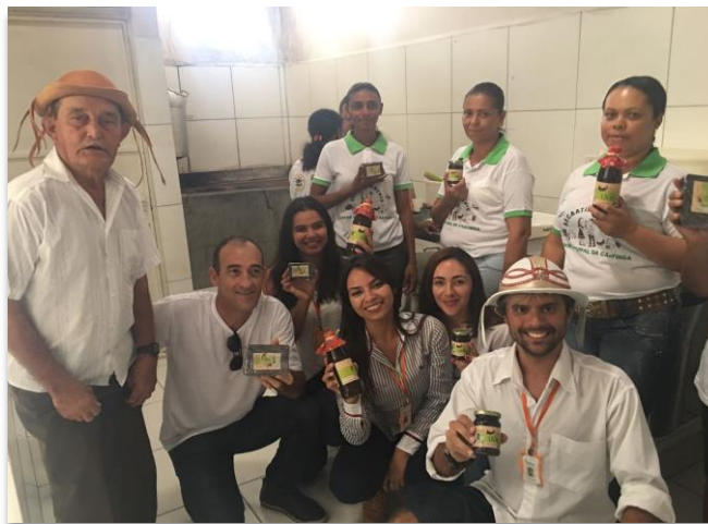
Time Enactus UNIVASF com parte dos Associados e os seus produtos fabricados