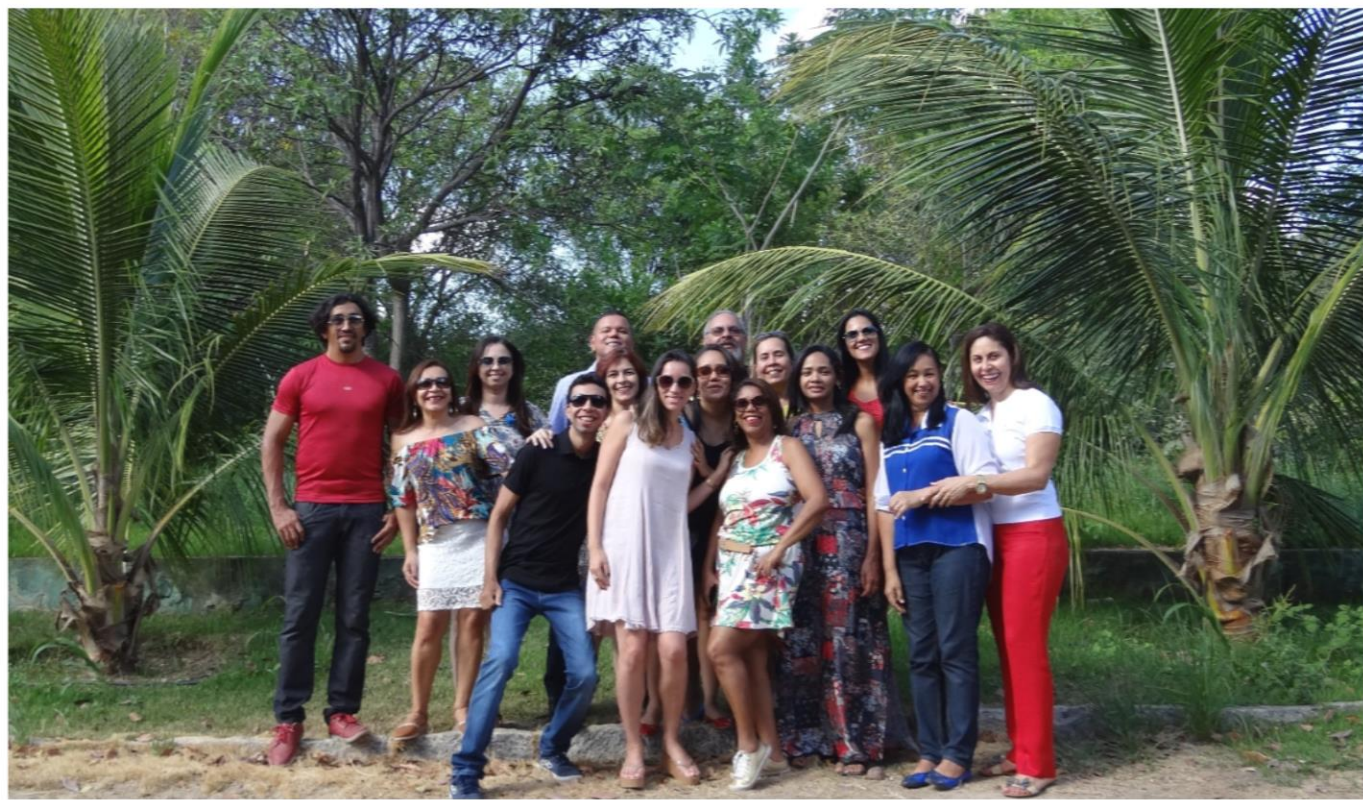
Equipe SIASS UNIVASF.

No limiar de um novo ano, sempre renovamos a nossa esperança por tempos ainda melhores. Desejamos a todos um 2017 cheio de paz, saúde e realizações.